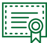
Voltar a estudar

Exemplos de eventos e compras avultadas para o ajudar a pensar: